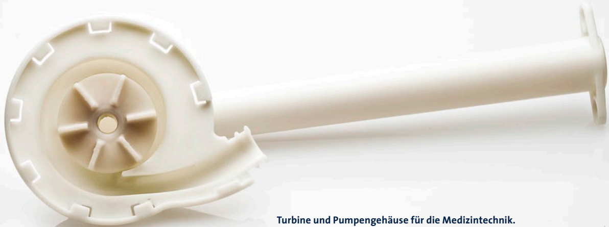
Turbine und Pumpengehäuse für die Medizintechnik. Baugruppe aus vier Einzelteilen, spritzgegossen aus verstärktem Polybutylenterephthalat (PBT GF).